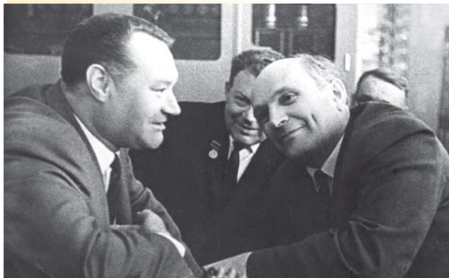
1966 год. Единомышленники. И.И. Каминский, генеральный директор ЛОЭП «Светлана» в 1962–1969 годах, Я.А. Кацман, главный инженер ЛОЭП «Светлана», А.И. Шокин, министр электронной промышленности СССР

«Таких рабочих собраний, как в первые годы объединения, я не помню, –