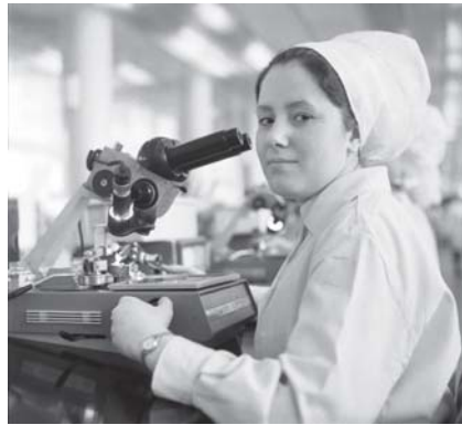
У «Светланы» женское лицо. Красивое, приветливое, одухотворенное